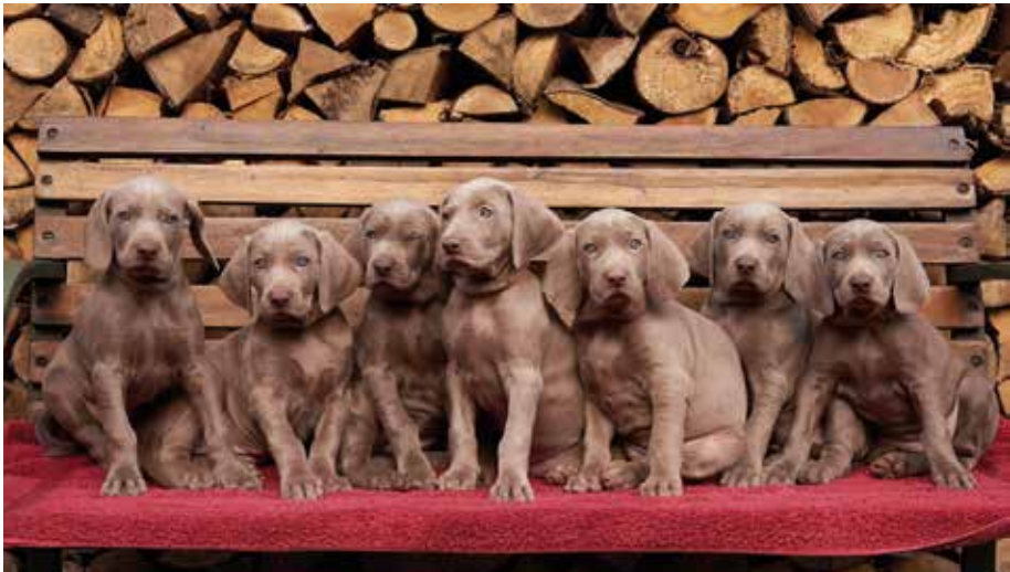
B-Wurf vom Wodangrund