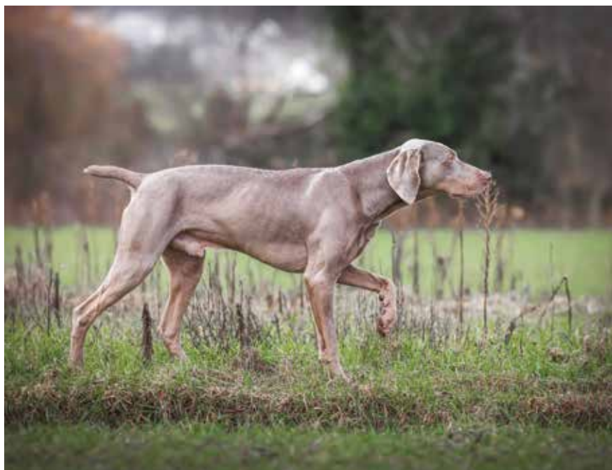
Enno vom Dragonersgrund